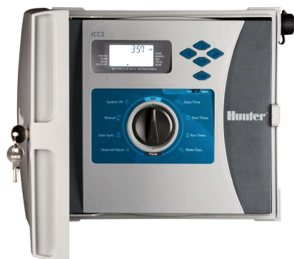
大規模用 100V 電源式コントローラー