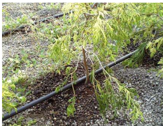
灌水チューブ「ドリップチューブ」