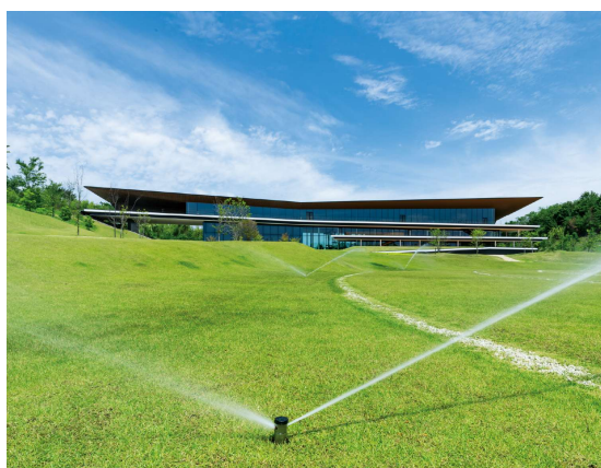
大規模用スプリンクラー