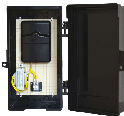
SMART-IS (スマートアイエス) コントローラー