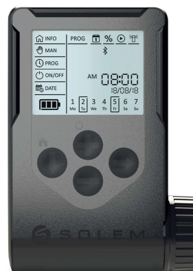
WooBee (ウービー) コントローラー