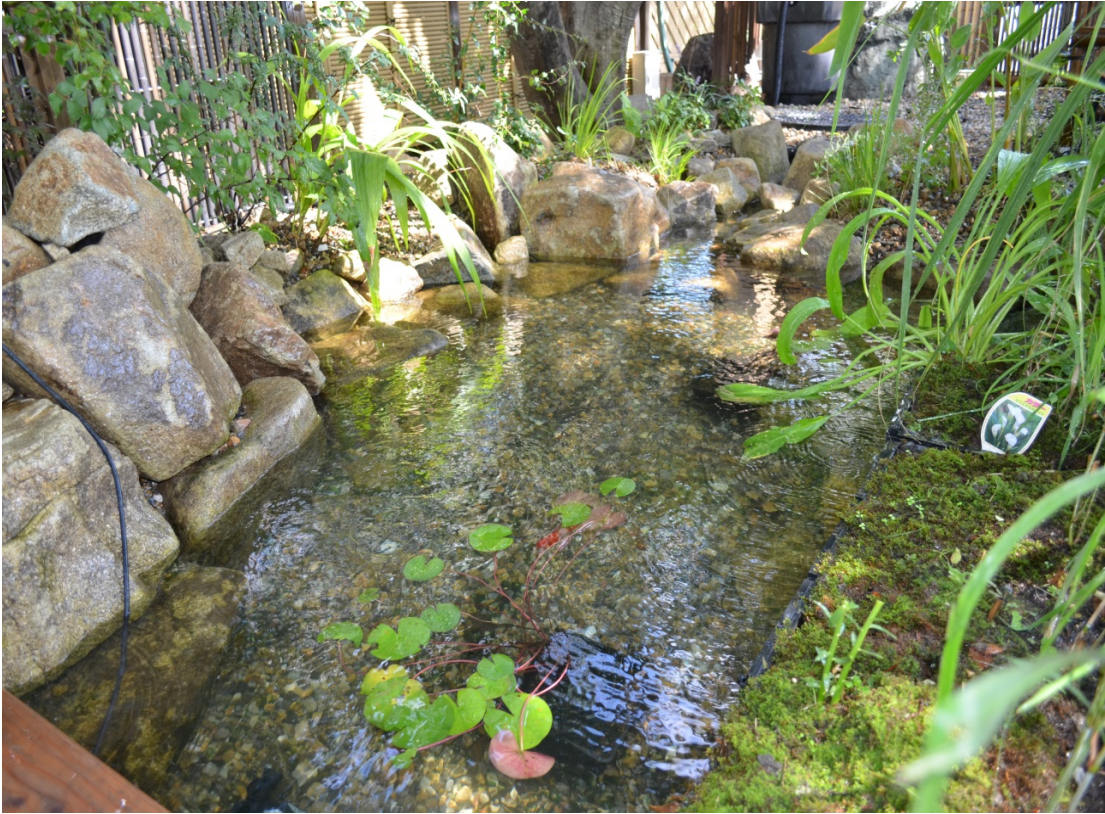
リリーポンド「グローベン展示場」