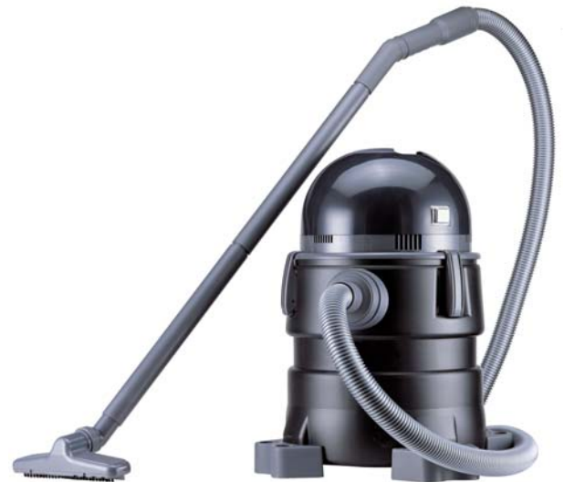
メンテナンス用水中掃除機 「ポンドバキューム」