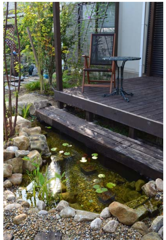
ストレージポンド施工例