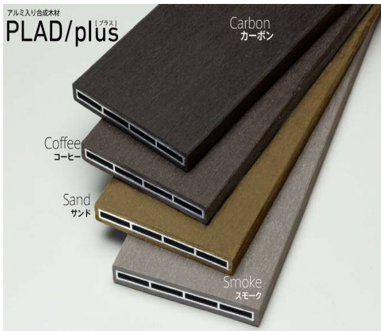
4色カラーバリエーション