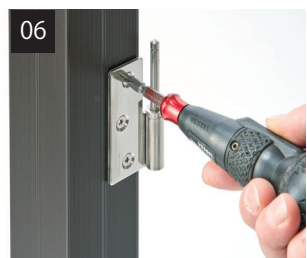
吊元柱に丁番を取り付けます