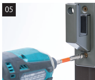
レバー受けを取り付けます