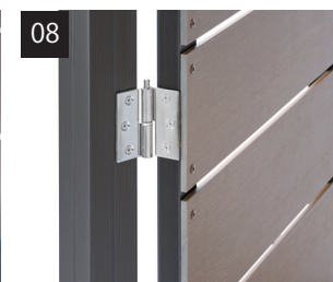
必要に応じてストッパーリングを取り付けて完成です（任意）