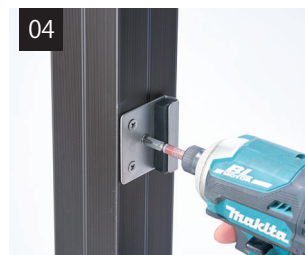
柱に戸当りを取り付けます